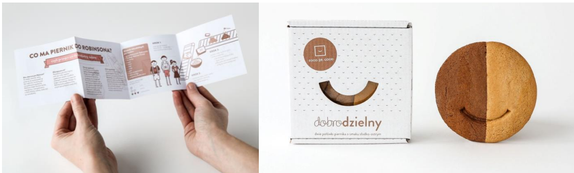
Pierniki wypiekane w ramach warsztatów „Food for Good”

W 2018 r. Robinsonowie poprowadzili 1 warsztat z pieczenia pierników dobrodzielnych dla wolontariuszy z firmy XI Catlin Servieces SE („Food for good”). Pracownicy fundacji przeprowadzili też 2 warsztaty połączone z grą ekonomiczną „Robinson na plusie” dla młodzieży ze stowarzyszenia „Serduszko dla dzieci” oraz dla młodzieży z Oddziału Terenowego Towarzystwa Rozwijania Aktywności Dzieci „Szansa” Warszawa Targówek.